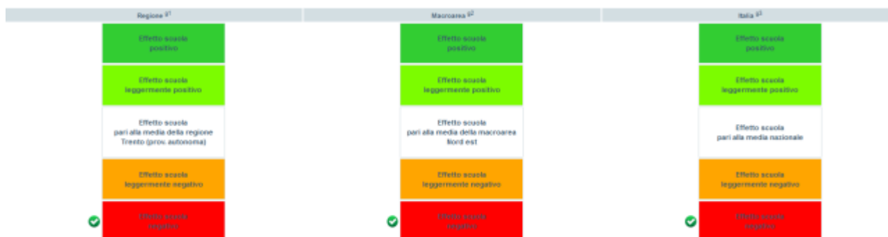
Figura 2. La restituzione dell' effetto scuola

Il risultato del calcolo dell' effetto scuola è restituito in forma grafica (figura 2) su base nazionale, rispetto alla macro-area geografica e alla regione di appartenenza.